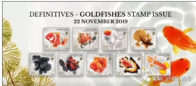
新加坡 2019 年 11 月 22 日发行“金鱼”普通邮票一套 9 枚。

爱沙尼亚 2019 年 11 月 19 日继续发行“邮政标识”普通邮票，这次在 2017 年 1 月 18 日发行的同图同面值邮票上变更了新的年份。