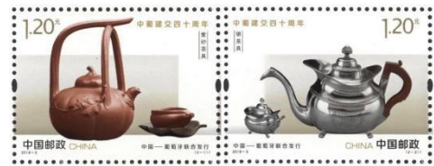
2019-3 中国葡萄牙建交 40 周年 影写版印制

2019 年 10 月 28 日，中国邮票印制局与九十年代末即开始合作的世界领先的德国格贝尔公司签约，引进世界一流的胶雕套印设备用来替换已经使用了 60 年的影写版印刷机。